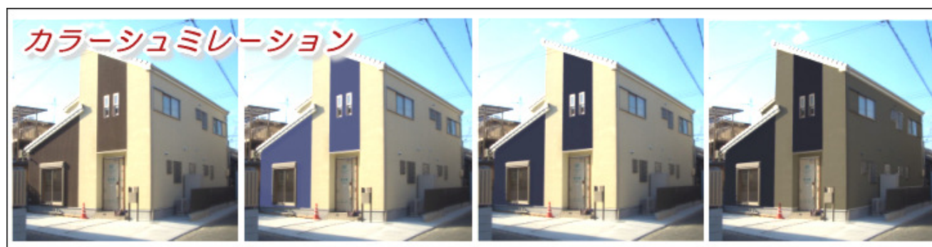
↑ カラーシュミレーション