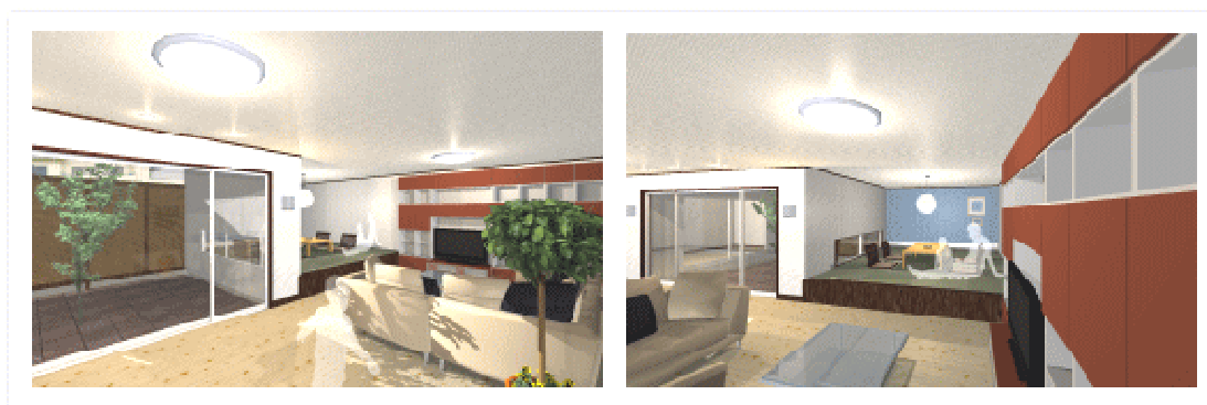
↑ 内観イメージパース