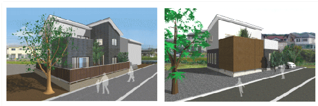
↑ 外観イメージパース

当工務店では、図面だけでなく、外観・内観・鳥瞰など、様々なパースを作成して、住まいづくりをサポート致します。